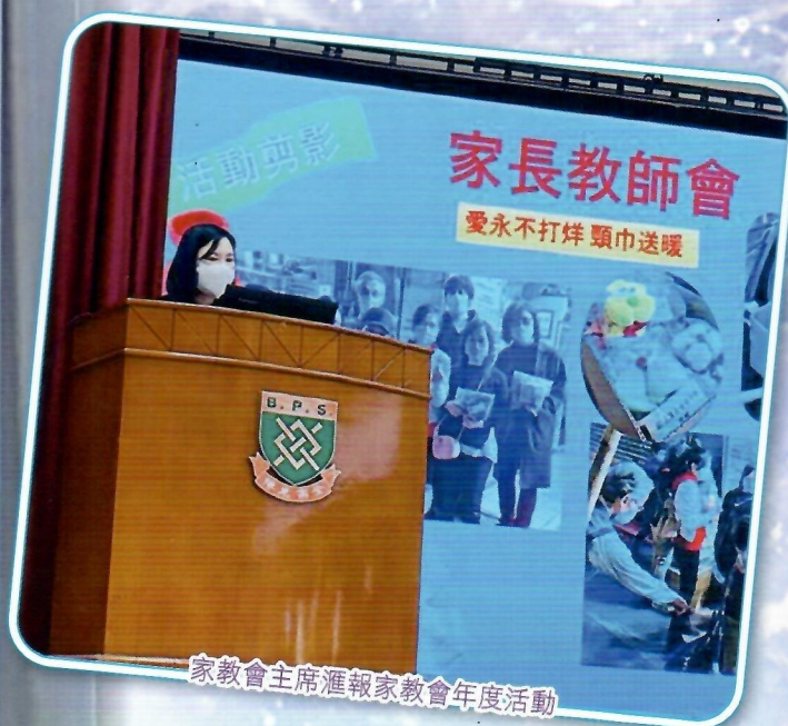
家教會主席匯報家教會年度活動