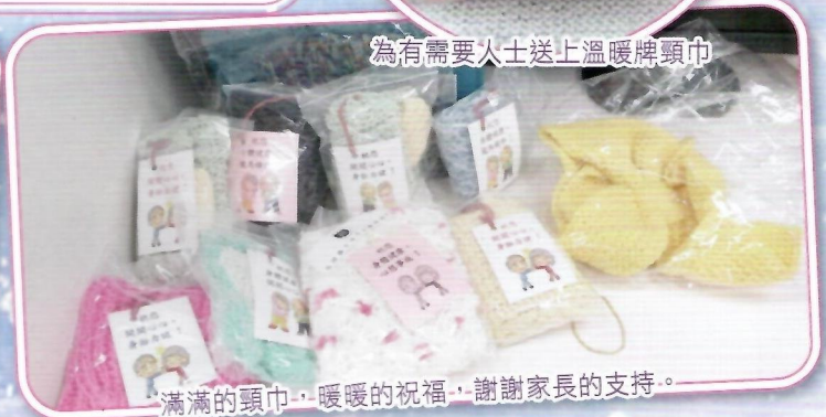
滿滿的頸巾，暖暖的祝福，謝謝家長的支持。