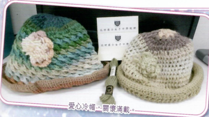
愛心冷帽，關懷滿載。