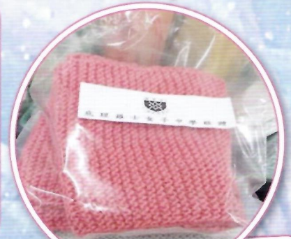
為有需要人士送上溫暖牌頸巾