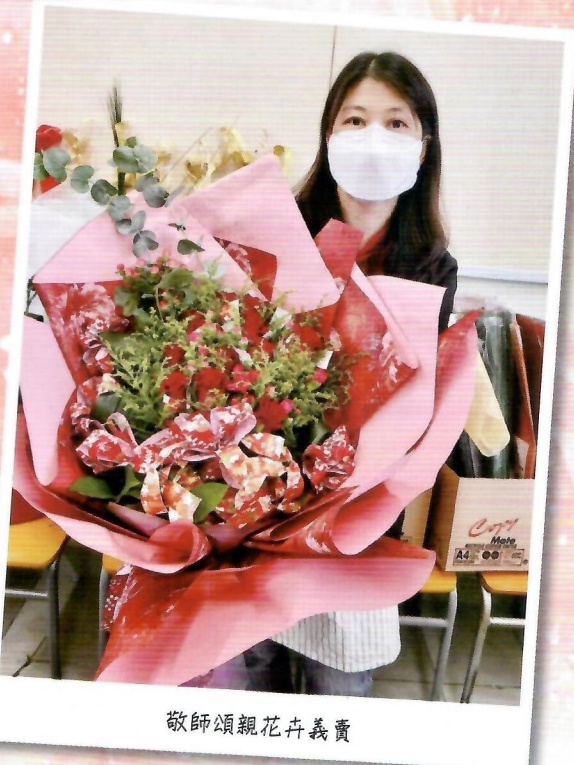
敬師頌親花卉義賣