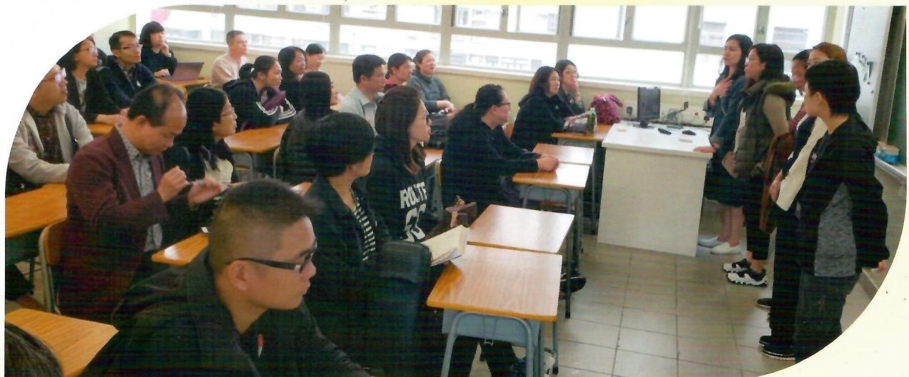
委員及義工家長與小六家長們分享選校心得。