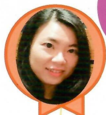
傅書曼秘書 出版小組、網頁小組