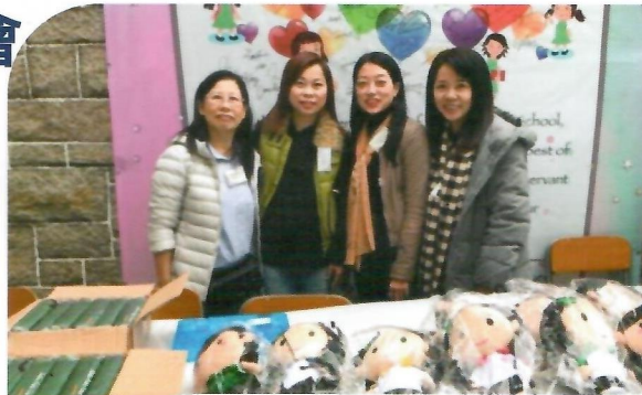
委員時刻不忘為PTA籌款。