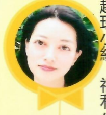
江詩韻委員 出版小組、福利 小組、籌款小組