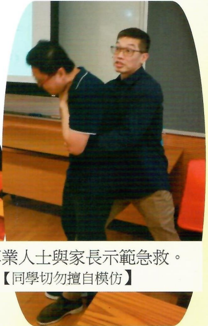
救護專業人士與家長示範急救。 【同學切勿擅自模仿】