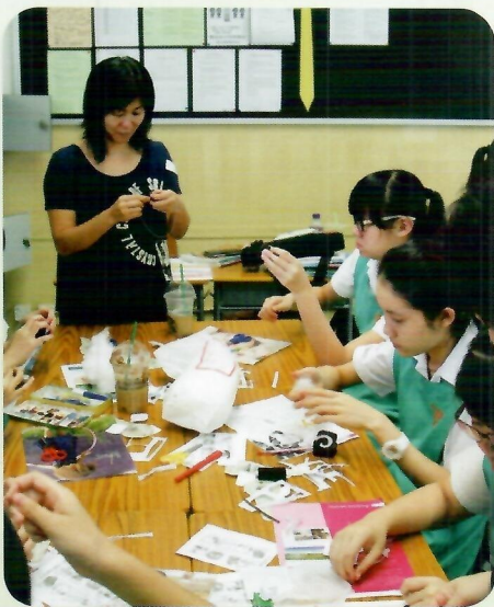
校長巡堂：看，同學們學得多開心。