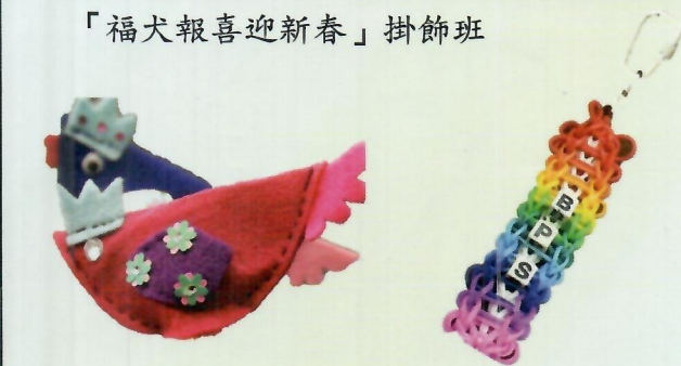
「雞年布藝吊飾」製作班