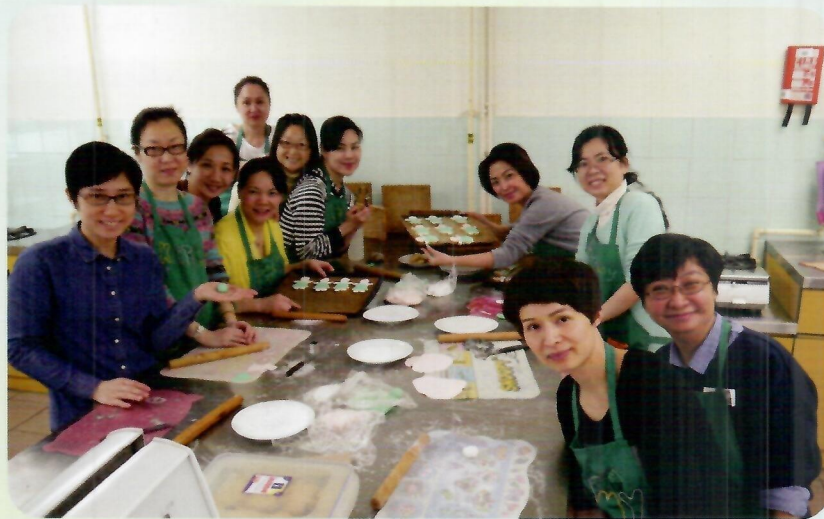
「小白菜餅乾」製作班