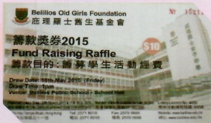
公開監察 抽獎過程