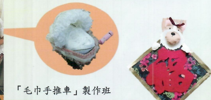
「毛巾手推車」製作班