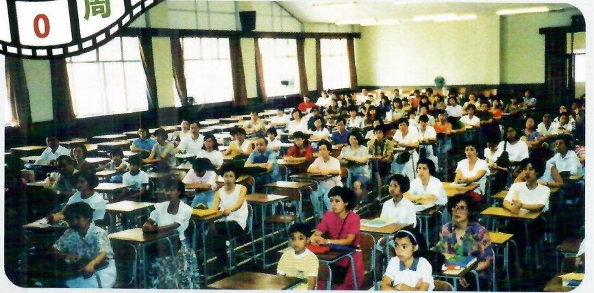
中一新生註冊 家長與學生在禮堂報到，家教會義工家長也幫忙。