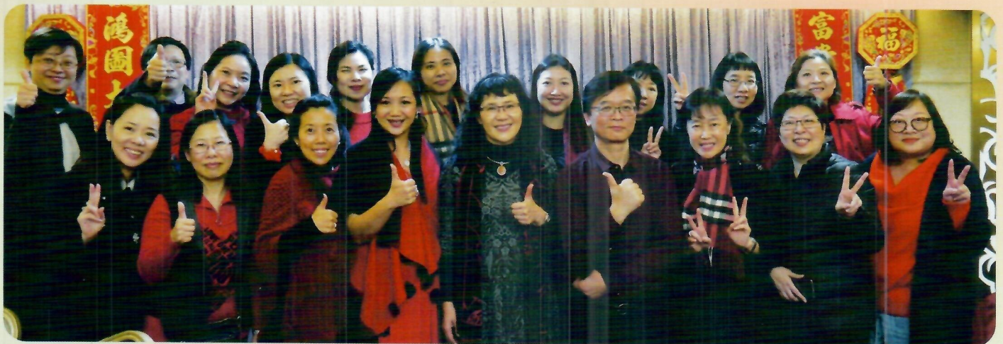
晚宴成功舉行，你們辛苦了。