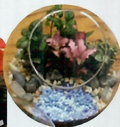
家長親手製作送予校方的盆景擺設