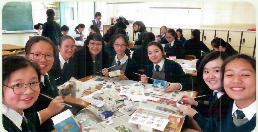
家長認真教導，同學們更認真學習。