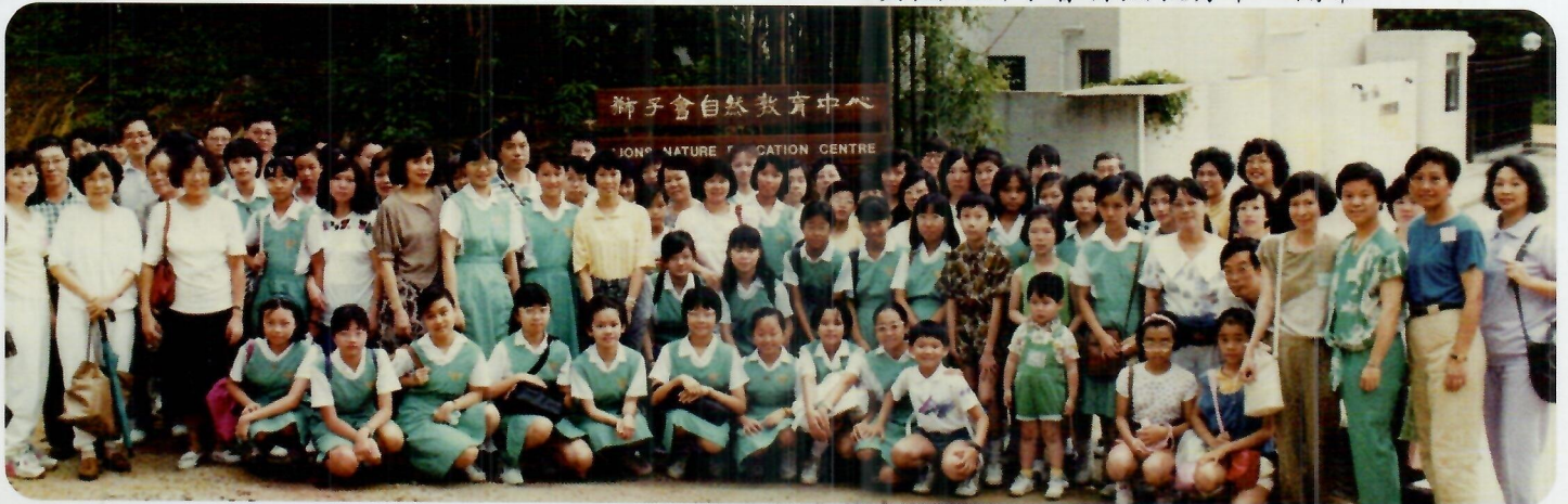
1991年6月 - 西貢蕉坑獅子會自然教育中心開幕