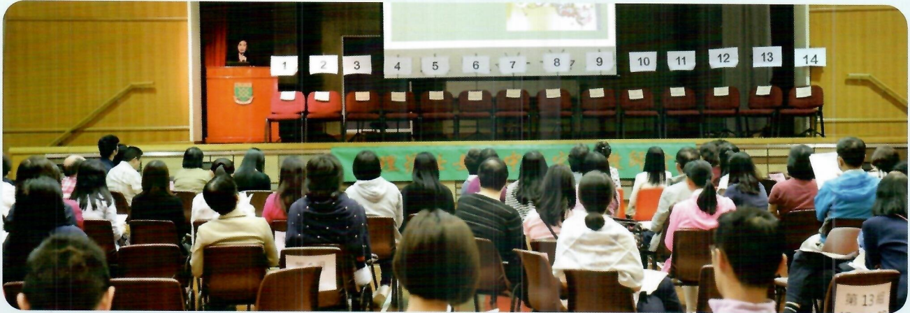
2017. 11. 04 - 會員周年大會

家長教師會的成員包括在讀學生家長（以家庭計算，自願繳費入會）及全校老師（包括校長）。