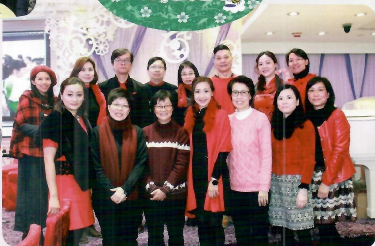
2016: 執委們 - 來個「滿堂紅」