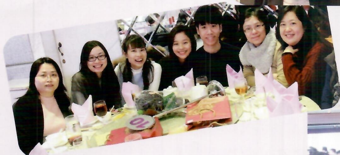
老師、學生 歡聚一堂