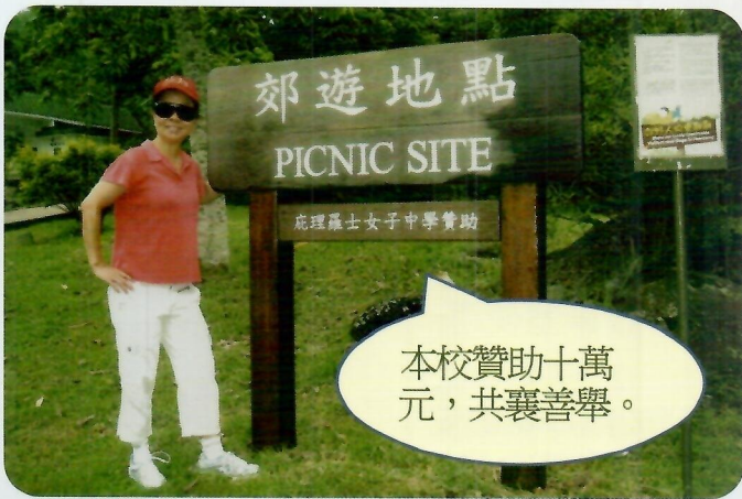
本校贊助十萬元，共襄善舉。