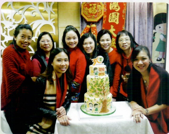
主席和她的「姊妹兵團」

作為2017-18年度庇理羅士女子中學家長教師會主席，我將秉承前輩創立的扎實根基與良好傳統，與副主席及眾委員同心同德、繼續邁進，積極推動家校合作，為我們的女兒們畫出更美好的將來！