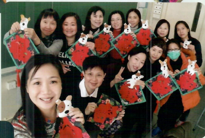
「福犬報喜迎新春」掛飾班