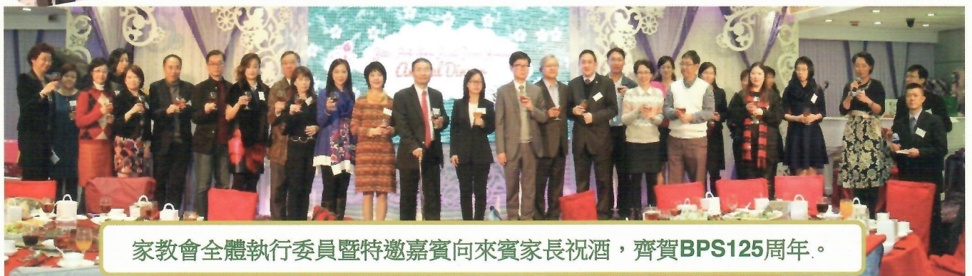
家教會全體執行委員暨特邀嘉賓向來賓家長祝酒，齊賀BPS125周年。