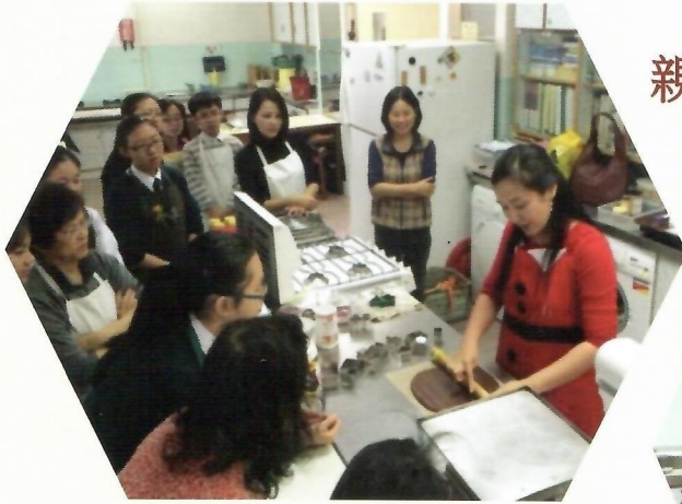
親子薑餅屋手作坊 2014年12月6日